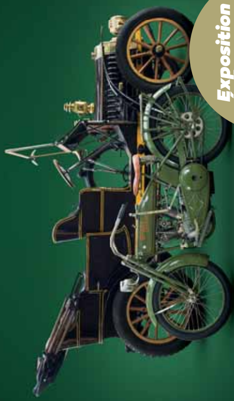
De Dion Bouton, BH 1908 Harley Davidson, 1917

Exposition Évènement 2018 NOS BELLES CENTENAIRES